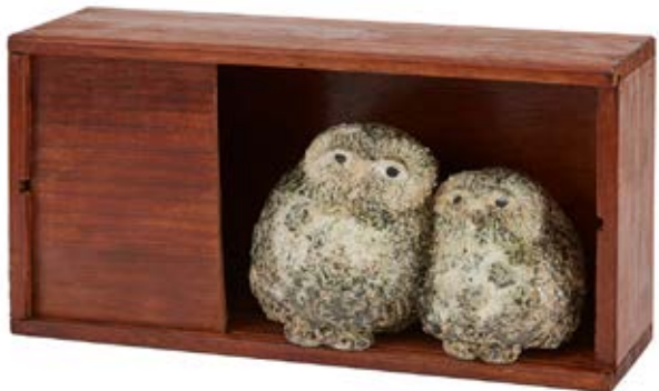
Uilenkastje Samen een uiltje knappen.

Na mijn opleiding als historicus en werkzaam te zijn geweest in een aantal wetenschappelijke bibliotheken, mijn laatste functie vervulde ik bij het wetenschappelijk onderzoekscentrum van het Ministerie van Justitie, vond ik het tijd worden om naast mijn vooral zittende beroep met de vele vergaderingen mijn aandacht te verleggen naar een ander terrein van activiteiten en te ontdekken in hoeverre ik mij op creatief terrein zou kunnen ontplooiën.